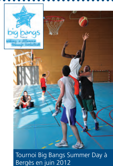
Tournoi Big Bangs Summer Day à Bergès en juin 2012

La prochaine gazette de juillet/août sera distribuée du 27 juin au 1 er juillet.